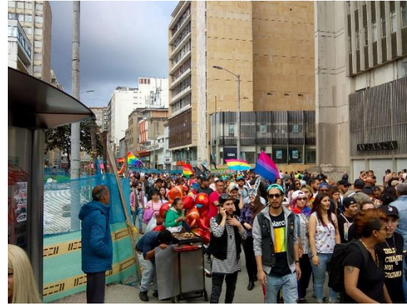
Fotos carrera séptima con calle 16.

Los datos recolectados recibieron un ajuste por omisión del 10%, esto quiere decir que se suma este porcentaje para suplir cualquier tipo de omisión al momento de registrar los marchantes, por ejemplo, que por alguna razón no alcanzaba a ver completamente a los marchantes o sencillamente por distracción de quien realiza el conteo o si en algún momento no fue posible contar por la densidad de público etc.: